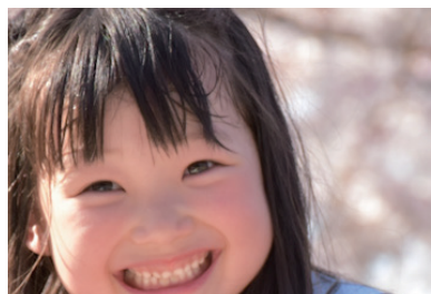
デジタルシステムを【利用】する場合